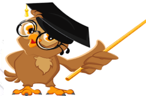
Навчальна та тренінгова складова (навчальні програми, семінари, тренінги, конференції тощо)