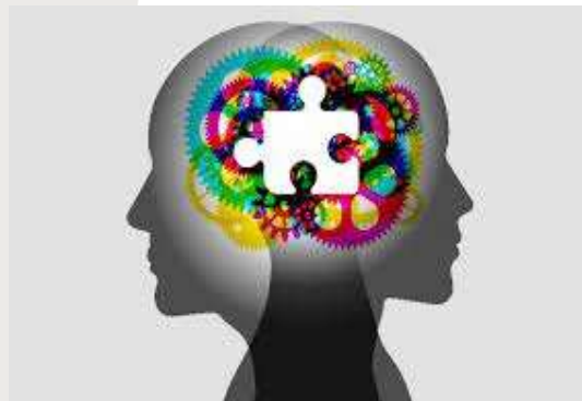
Методологічна підтримка ФУК та ВА (посібники, вказівки тощо)