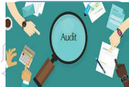
Пілоты із ВА та ФУК