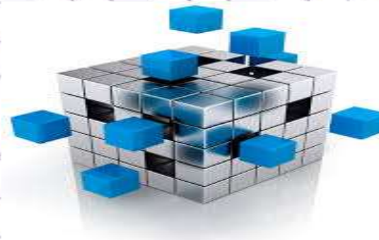
Розвиток ВА (Оцінка якості ВА, Сертифікація ВА).....