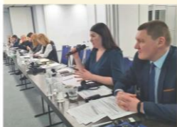
На фото - друга справа

ООН Жінки, Програми ULEAD з Європою. Крім того, в рамках навчального візиту в Житомирську область іноземні гості ознайомилися з результатами впровадження та застосування гендерного підходу в області, а також з можливими викликами на місцевому рівні.